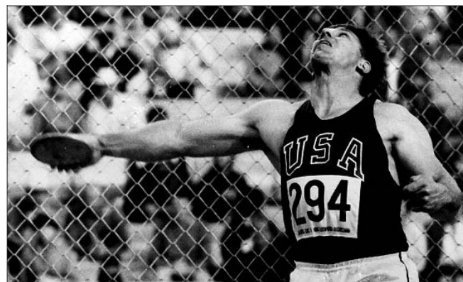
GULD - IGEN. Ved OL i 1968 vandt Al Oerter sin 4. og sidste guldmedalje med et kast på 64,78 meter.