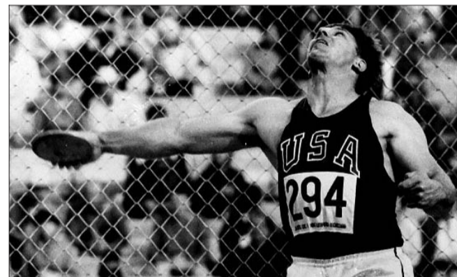
GULD - IGEN. Ved OL i 1968 vandt Al Oerter sin 4. og sidste guldmedalje med et kast på 64,78 meter.

Oerter blev født i staten New York i 1936. Da han gik i high school, viste det sig, at han kunne kaste en diskos længe - end nogen anden amerikaner på sin egen alder. Han blev sendt på universitetet i Kansas og satte straks ny diskosrekord inden for universitetsidræt. Han blev i 1956 udtaget til OL i Melbourne i Australien uden nogen sinde at have deltaget i et større internationalt stævne. Den manglende erfaring